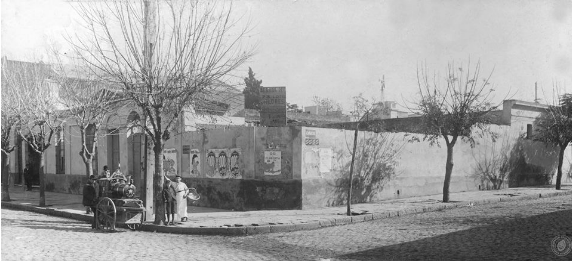
Figura 1: Calle Caracas, Flores, Buenos Aires

Admirados lo examinaron los muchachos de la vecindad, y ello les evidenció mi superioridad intelectual, que desde entonces prevaleció en las expediciones organizadas para ir a robar fruta o descubrir tesoros enterrados en los despoblados que estaban más allá del arroyo Maldonado en la Parroquia de San José de Flores (Arlt [1926] 1981: 15).