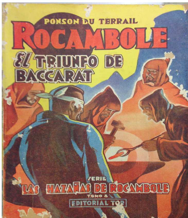
Figura 3: Las hazañas de Rocambole

La novela de carácter autobiográfico da cuenta de la pasión del protagonista (y del autor) por la lectura de la literatura folletinesca, no solo el folletín sino una amplia heterogeneidad de literatura popular impresa que configura el campo de lectura entre 1880 y 1910: periódicos, revistas y libros que consumieron los nuevos contingentes de lectores surgidos del proyecto de alfabetización en el período de entre-siglos (Prieto 1987). Las hazañas de Rocambole (figura 3) de Pierre-Alexis Ponson du Terrail, folletín de amplia difusión en el ámbito hispánico, es un modelo para Silvio Astier, quien admira la voluntad de trabajo del protagonista y su capacidad de hacer dinero. A partir de la imitación a Rocambole, Arlt construye la subjetividad de su personaje como la del héroe popular que interactúa sin éxito en distintos estratos sociales, con efectos que Sarlo denominó “la fantasía reparadora del folletín decimonónico (riqueza, gloria, amor)” (Sarlo 1988: 59).