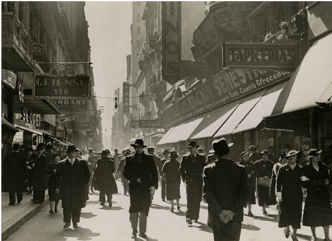
Horacio Coppola (Coppola y Prebisch 1936)

En estas páginas Arlt caracteriza las formas de convivialidad en el centro, un espacio que distintas clases sociales transitan de modo conjunto y separado. El territorio surcado por personas muy diferentes que se rozan sin verse se traduce en la escena del camino hacia el Mercado del Plata, en la que se pintan con trazos certeros la diversidad, la pobreza y la abundancia de alimentos: